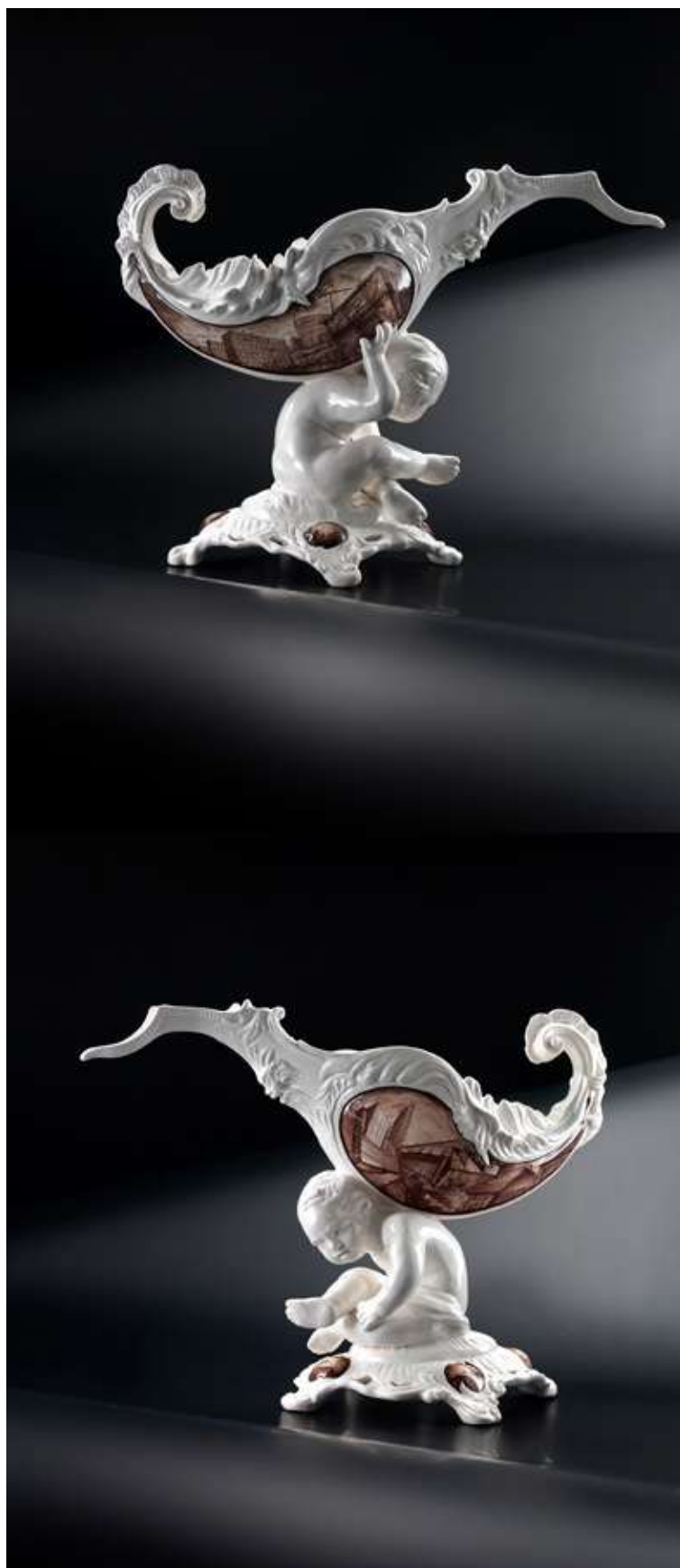
"Capriccio contemporaneo su modello 1800 manifattura Antonibon, Nove (VI) " Collettiva finalisti 56° Concorso Internazionale della Ceramica Contemporanea di Faenza.2009