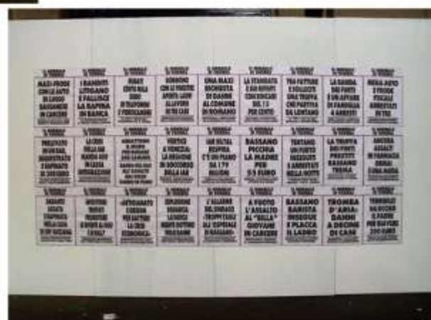
"Titoli di cronaca nella zona di Bassano del Grappa (VI) sul tema dei soldi da marzo 2004 a marzo 2005" Installazione ambientale Collettiva finalisti del concorso "Honey Money, il gusto dei soldi" Spazio Assab one MILANO 2005