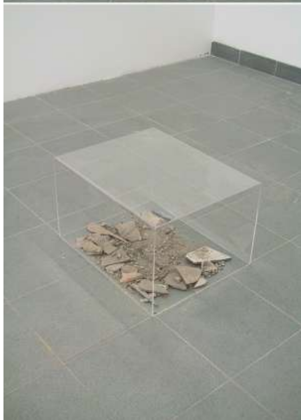
"traslazione n1" Installazione ambientale. Foto, materiali di recupero, plexiglas Collettiva Atelier Aperti. Laboratorio di Decorazione B. Accademia di Belle Arti di Venezia.2005