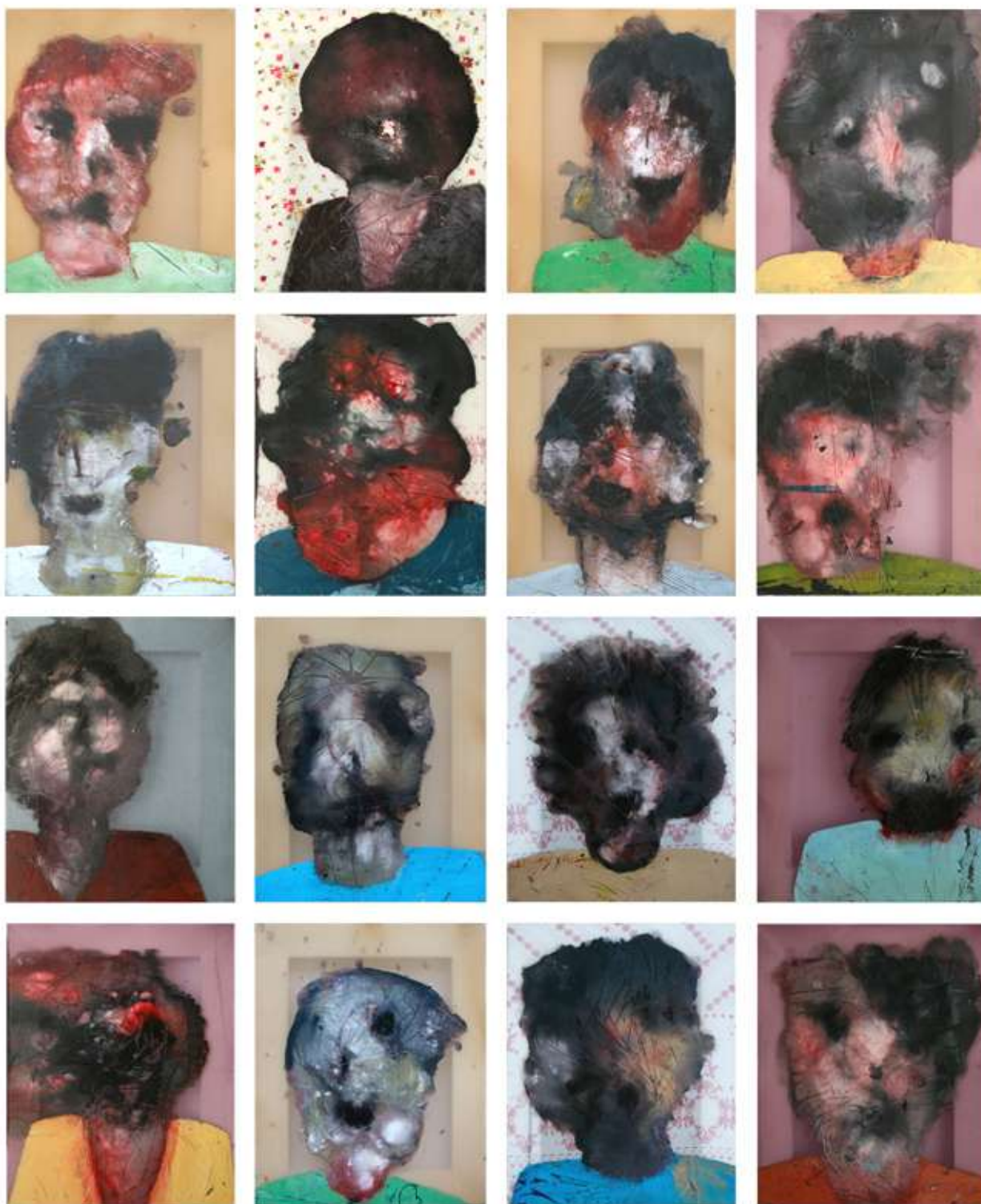
"Je le vois dans la rue" N°12 27x22 cm. Tecnica mista su tessuto Paris 2010