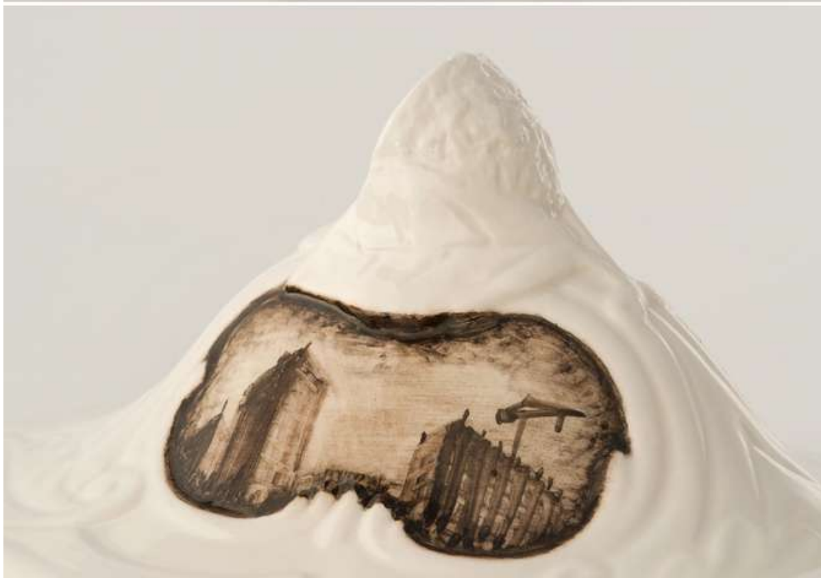
"Capricci contemporanei" Mostra personale presso l'Androne della Manifattura Antonibon ,ora Barettoni. Nove (VI) 2008