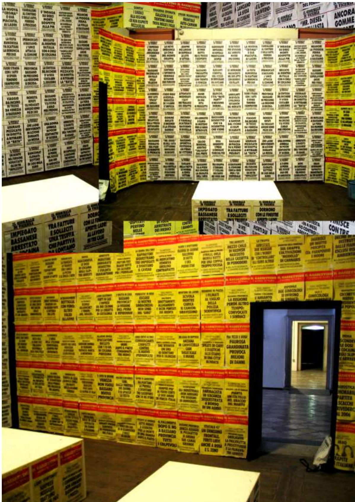
"Cronaca poetica" Installazione site specific "Piccolo Festival della letteratura" Palazzo Bonaguro. Bassano del Grappa (VI)2006