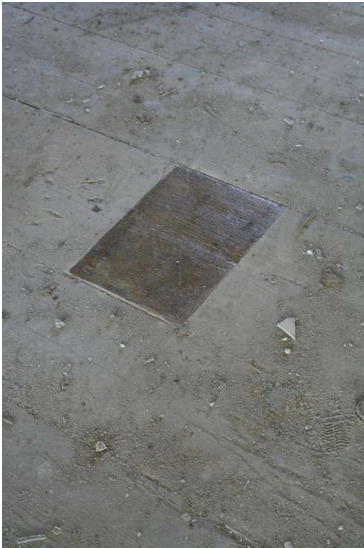
"Evoluzione spazio-tempo" Interventi site specific presso l'ex fabbrica di ceramiche Zanolli. Nove (VI) 2007